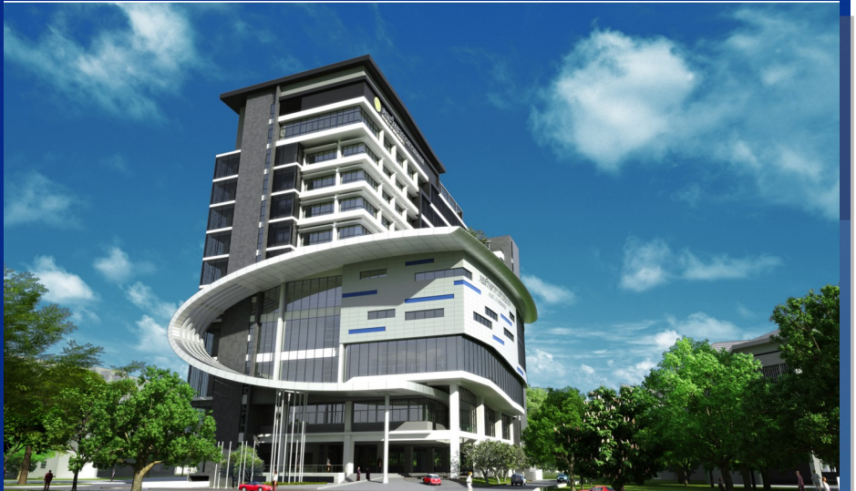
"สร้างอารยะบัณฑิต มุ่งแนวคิดสากล นำพาสังคมอย่างยั่งยืน ด้วยวิทยาการสารสนเทศ"

สวัสดีครับท่านผู้อ่านทุกท่าน กลับมาพบกันอีกแล้วนะครับสำหรับจดหมายข่าว คณะวิทยาการสารสนเทศฉบับเดือนมิถุนายน ช่วงนี้ยังคงอยู่ในระหว่างการพักผ่อนและปิดภาคเรียนสำหรับนิสิต แต่ยังมีนิตี้อีกส่วนหนึ่งที่กำลังอยู่ระหว่างการเรียนการสอนในภาคฤดูร้อน ประจำปีการศึกษา ๒๕๖๐ นี้ สำหรับสภาพอากาศในเดือนมิถุนายนนั้นยังคงแปรปรวนอยู่บ้าง มีแดดจัดสลับกับพายุฝนฟ้าคะนองในบางพื้นที่ คาดว่าประมาณเดือนกรกฎาคม ถึงเดือนสิงหาคมที่กำลังจะถึง ประเทศไทยจะเข้าสู่ฤดูฝนอย่างเป็นทางการ ซึ่งตรงกับ การเปิดภาคเรียนใหม่ ประจำปีการศึกษา ๒๕๖๑ พอดี และขอให้ท่านผู้อ่านรักษาสุขภาพให้แข็งแรงด้วยนะครับ